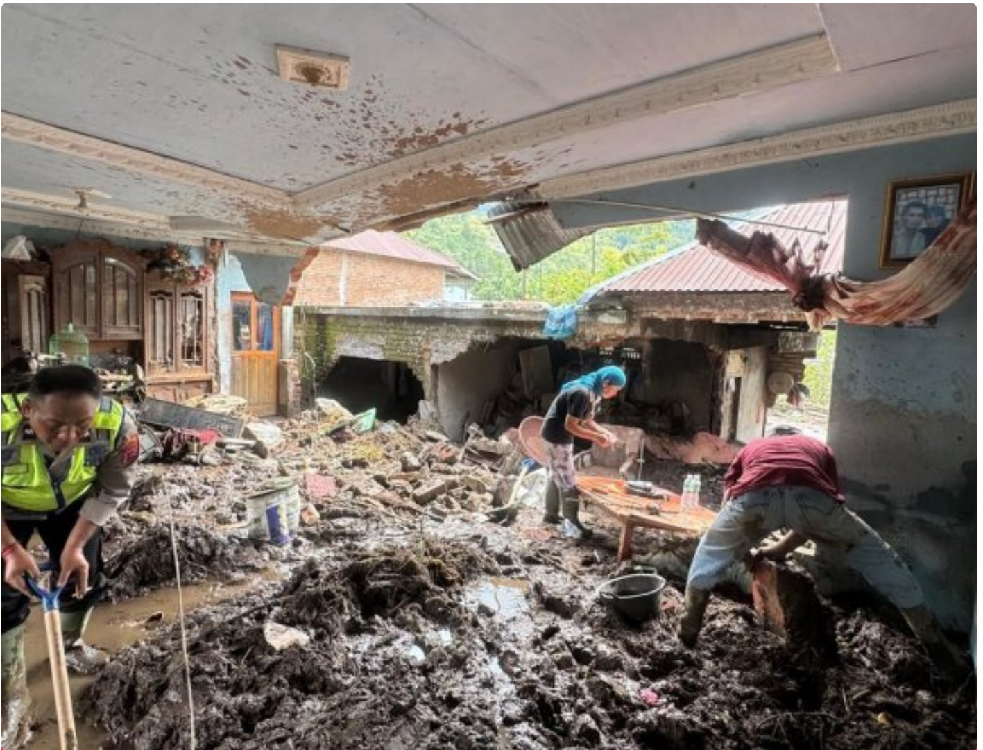
Polresta Bukittinggi Dirikan Posko Bencana dan Salurkan Bantuan di Kecamatan Malalak

Malalak, Agam — Polresta Bukittinggi kembali menunjukkan kesiapsiagaan dalam menghadapi bencana alam yang melanda wilayah hukumnya. Pada Kamis, 04 Desember 2025 dini hari, Tim Posko Bencana Polresta Bukittinggi tiba di Jorong Toboh, Nagari Malalak Timur, Kecamatan Malalak, Kabupaten Agam untuk melaksanakan tugas kemanusiaan.