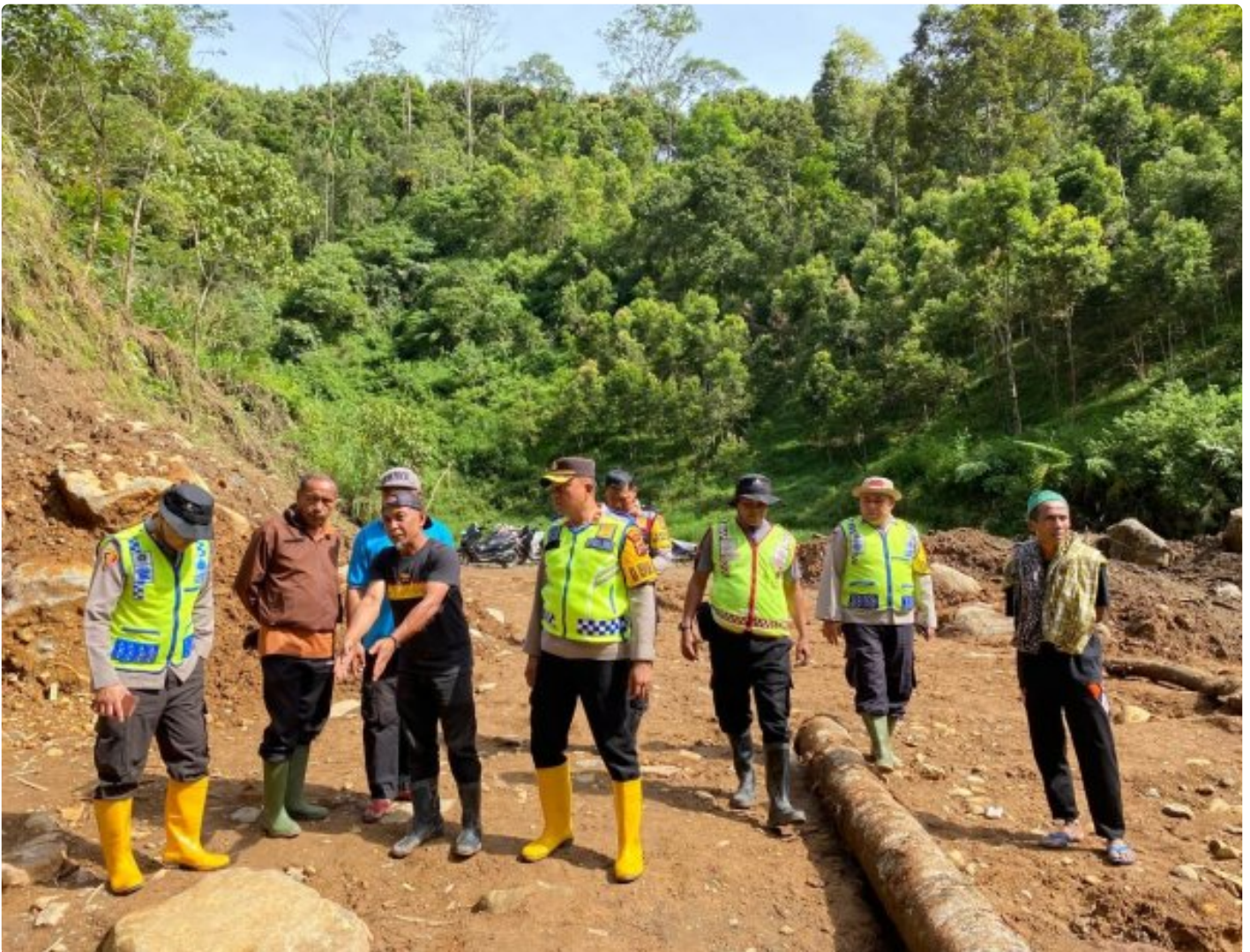
Polresta Bukittinggi Bergerak Cepat, Tinjau Lokasi Mata Air untuk Bangun Sumur Bor Air Bersih di Malalak Timur

Bukittinggi — Polresta Bukittinggi kembali menunjukkan kepeduliannya terhadap masyarakat terdampak bencana alam di Malalak Timur, Kecamatan Malalak, Kabupaten Agam. Sebagai langkah konkret, jajaran Polresta Bukittinggi meninjau langsung lokasi mata air yang direncanakan menjadi titik pembangunan sumur