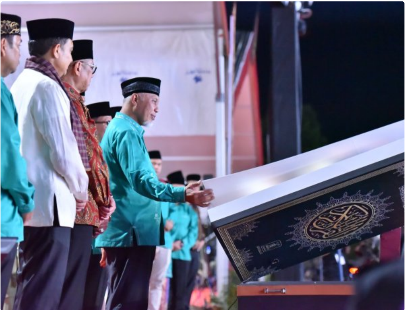
MTQN ke-41 Sumatera Barat Resmi Dibuka di Bukittinggi, Al-Qur'an Jadi Cahaya di Tengah Duka