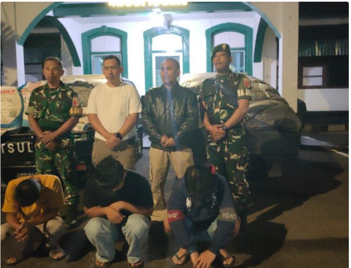
Kodim 0304/Agam Amankan Tiga Pelaku Penjualan Pupuk Bersubsidi di Gadut, Satu Orang Kabur

Bukittinggi — Aparat Kodim 0304/Agam berhasil mengamankan tiga orang terduga pelaku penyalahgunaan pupuk bersubsidi di wilayah Gadut, Agam Sumatera Barat, Jumat (17/04/2026) sekitar pukul 17.00 WIB.