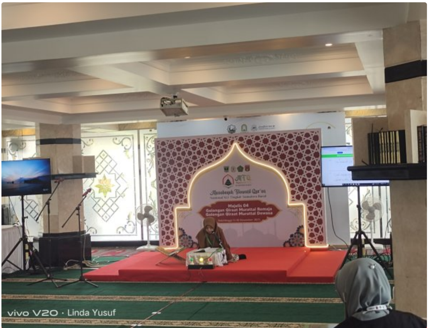
Salah satu peserta remaja putri

Bukittinggi – Pelaksanaan Musabaqah Tilawatil Qur'an (MTQ) Nasional ke-XLI Tingkat Provinsi Sumatera Barat terus berlangsung di Kota Bukittinggi. Salah satu lokasi cabang lomba digelar di Masjid Tangah Jua, Bukittinggi Minggu (14/12/2025), dengan suasana tertib dan penuh kekhusyukan.