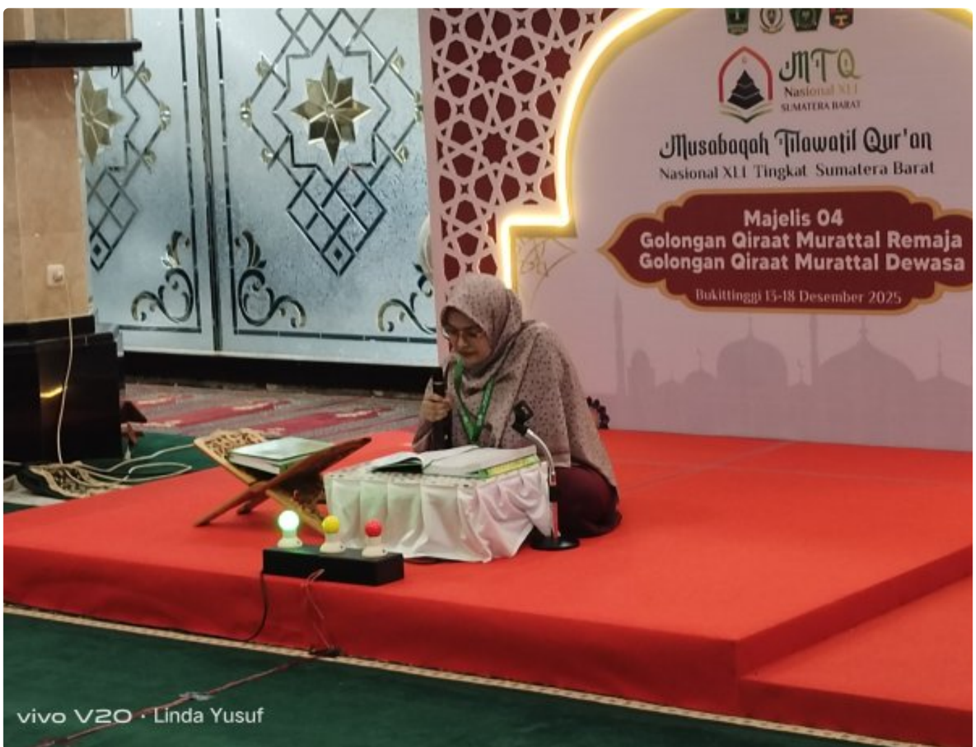
Salah satu peserta di Mesjid Tengah Jua

Bukittinggi – Lantunan ayat suci Al-Qur'an menggema dari berbagai sudut Kota Bukittinggi, Minggu (14/12/2025). Di tengah suasana duka akibat bencana yang masih dirasakan masyarakat Sumatera Barat, Musabaqah Tilawatil Qur'an (MTQ) Nasional ke-XLI Tingkat Provinsi Sumatera Barat justru menghadirkan